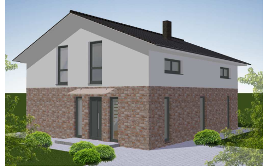
Eingangsseite: Variante I Verblender und Putz