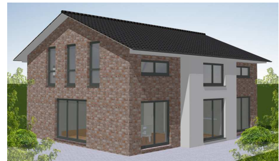
Terrassenseite: Variante II Verblender/Putz