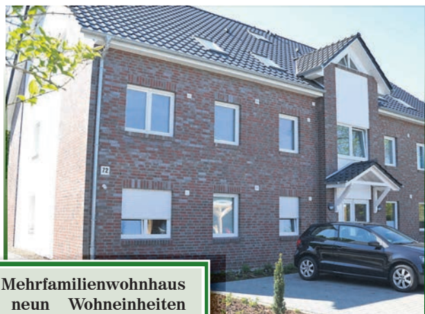
Ein Mehrfamilienwohnhaus mit neun Wohneinheiten in der Buchholzer Bremer Straße Nr. 72

Wer sich für ein perfekt durchdachtes Haus von WITO entscheidet, plant mit Sicherheit für die Zukunft.