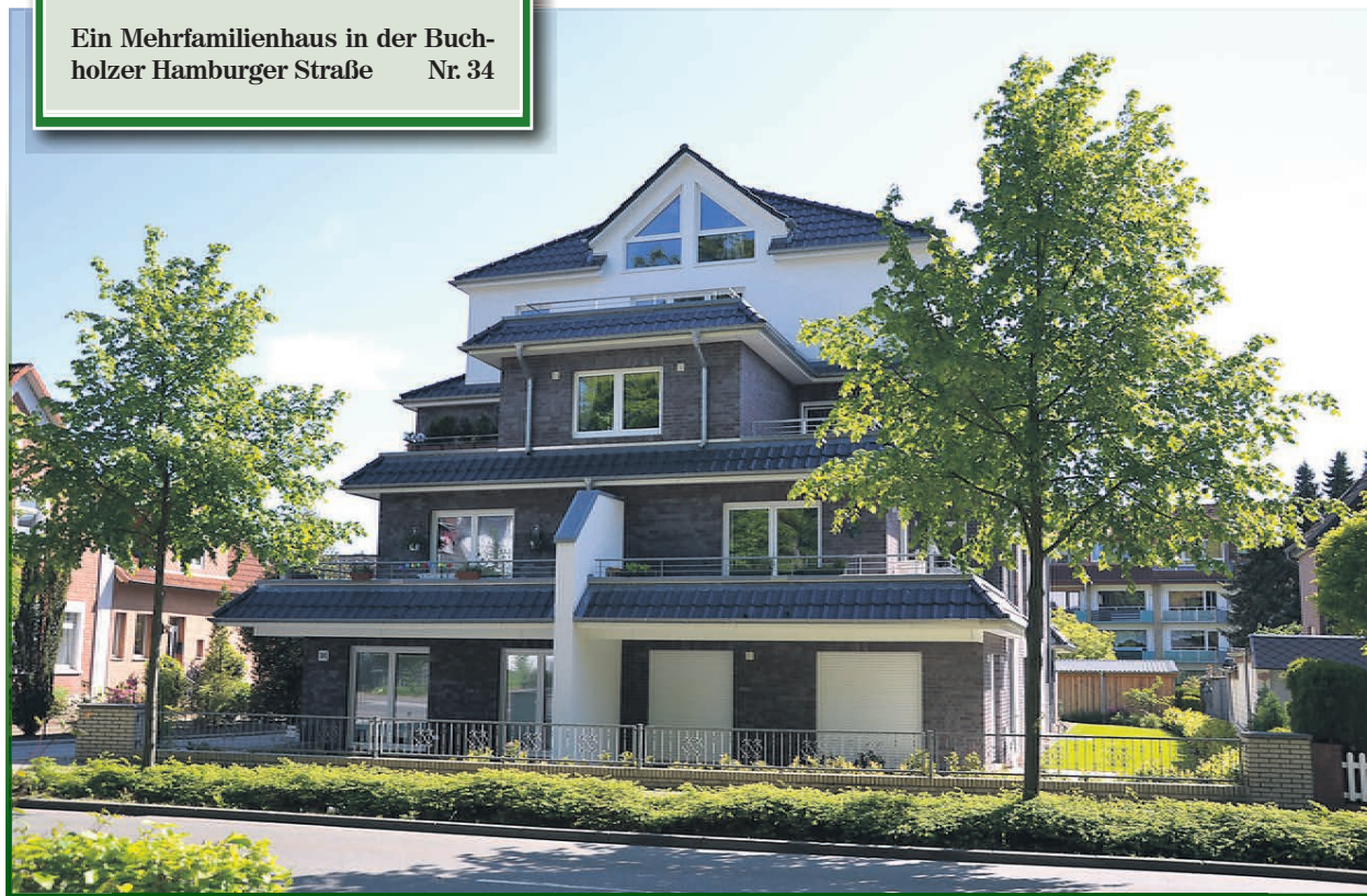
Ein Mehrfamilienhaus in der Buchholzer Hamburger Straße Nr. 34

Bürgermeister-Becker-Straße 9, Buchholz-Dibbersen Telefon: 0 41 81 / 21 92 10