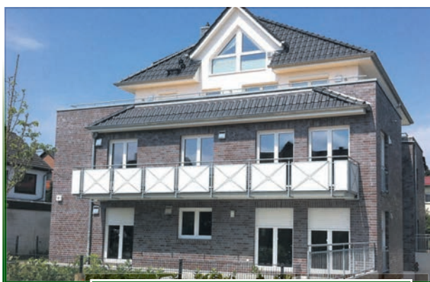
Ein Mehrfamilienwohnhaus in der Buchholzer Heinrichstraße Nr. 9