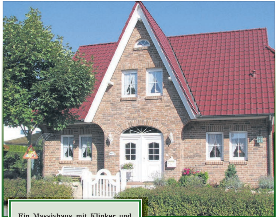
Ein Massivhaus mit Klinker und Friesenhausgiebel

Als neuer Geschäftszweig wurden nun neben der Bausträgergesellschaft auch frei geplante Einfamilienhäuser angeboten. Durch den großen Erfolg und Zuspruch der Bauinteressenten und späteren Bauherren wurde