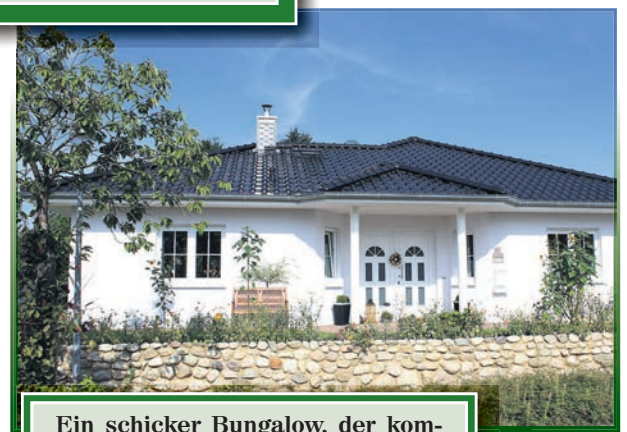
Ein schicker Bungalow, der komfortables Wohnen auf einer Ebene möglich macht