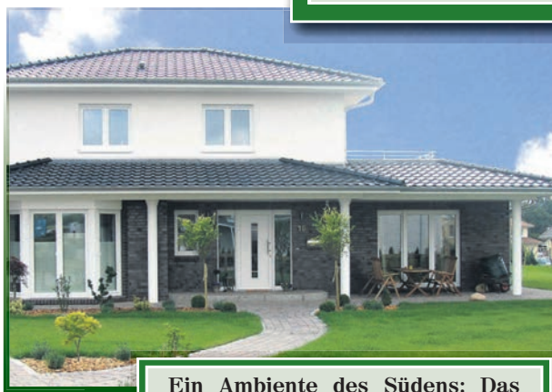
Ein Ambiente des Südens: Das Haus offeriert lichtdurchflutete Räume durch bodentiefe Fenster und geschützte Sitzflächen

• Ab 2004 wurden diverse Musterhäuser erstellt, so dass die Bauinteressenten auch WITO „live“ erleben konnten und sich einen Eindruck von der durchdachten Architektur, der ansprechenden Optik und der hochwertigen Bauweise machen konnten. Bei sämtlichen WITO-Häusern wurde und wird besonderer Wert auf den Wärmeschutz, die Haustechnik und die ansprechende Optik gelegt.