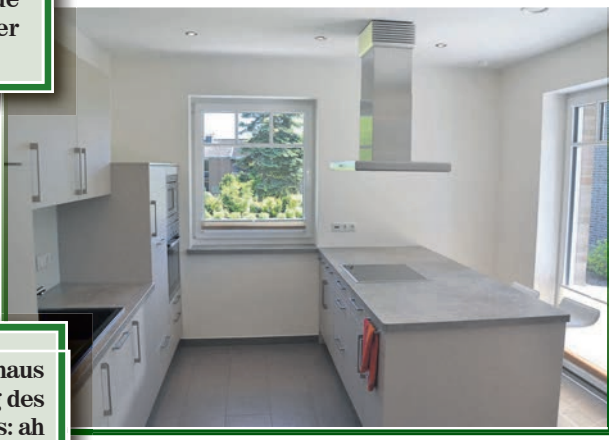
Die Küche in einem Musterhaus steht für die praktische Planung des WITO-Teams im Detail

„Bei allen unseren Häusern achten wir auch auf eine hochwertige Ausstattung. Der Kunde soll sich in seinem Haus wohlfühlen“, so Wilfried Wildemann.