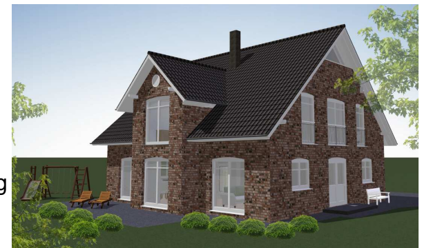
Terrassenseite / Eingangsseite