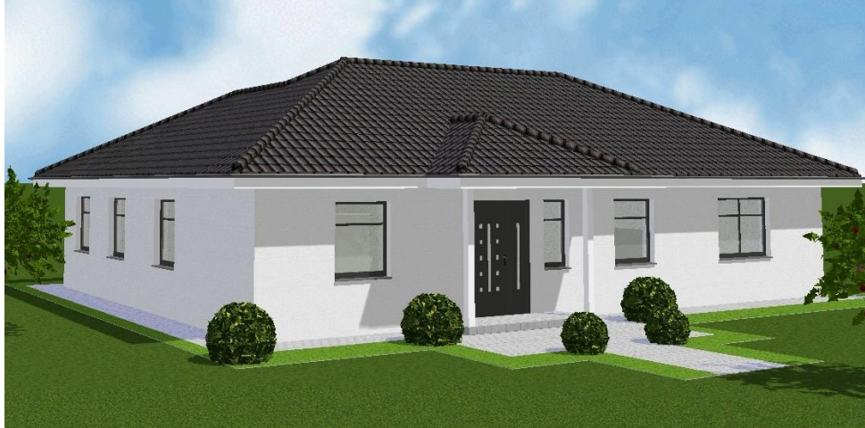
Typ Lerchenweg 1 – ohne Terrassenüberdachung

Wir bieten Ihnen den Bungalow Typ Lerchenweg 1 mit folgender hochwertiger Ausstattung an: