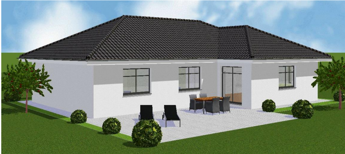
Bungalow Typ Lerchenweg 1 – ohne Terrassenüberdachung